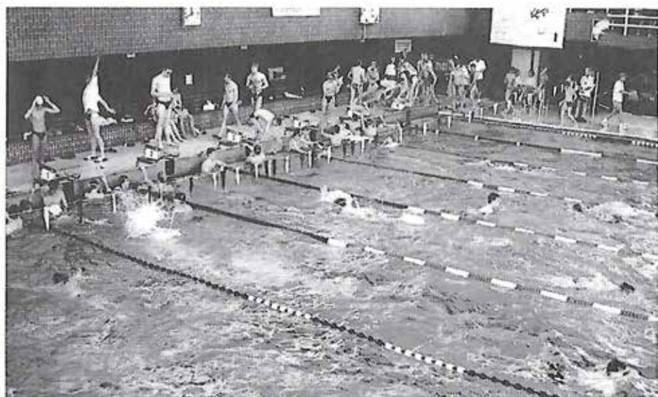
Einschwimmen vor dem Wettkampf