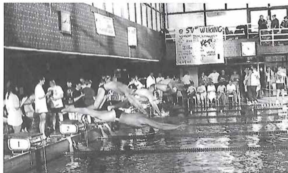
Wenn das kein Fehlstart war...?!