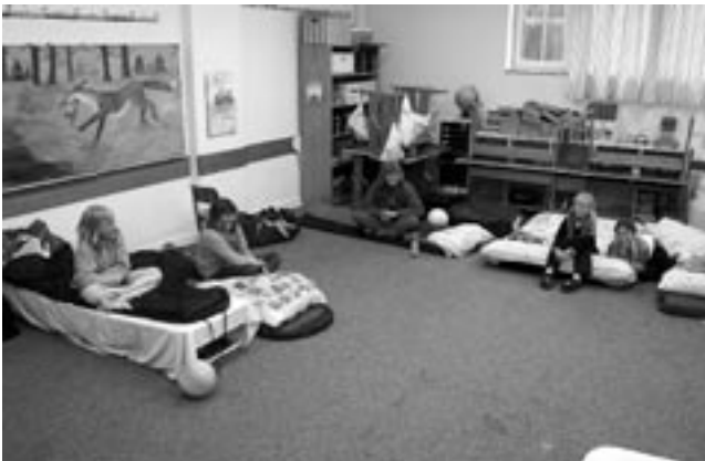
EIN MÄDCHEN-SCHLAF- SAAL