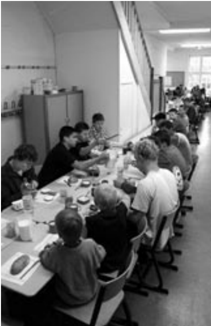
Bad Bramstedt

Ansonsten hatten wir bis zum Nachmittagstraining Freizeit. Das Nachmittagstraining fand aufgrund des großen Badebetriebes in zwei Gruppen statt, da wir ansonsten nicht genügend Bahnen gehabt hätten. Die erste Gruppe trainierte von 17.00 Uhr an eine Stunde, die zweite begann um 18.00 Uhr und war nach einer Stunde 30 Minuten fertig.