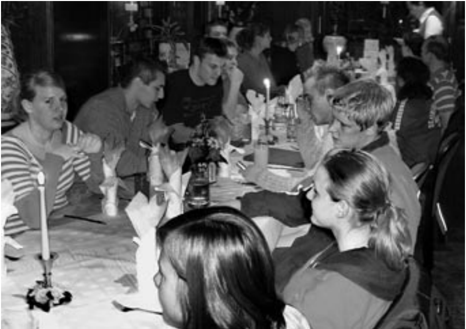
UNSERE HELDEN BEIM TRADITIONELLEN DMS-ABSCHLUSSESEN