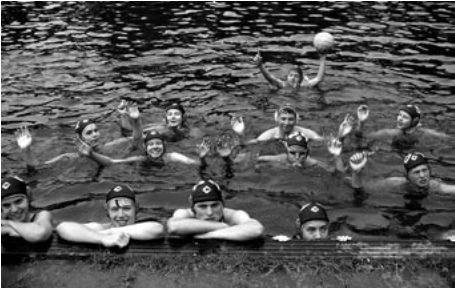
Die Jugend-Wasserballmannschaft im Naturbad Kiwitteemoor in HH-Langenhorn

Aber es sollte noch besser kommen: 15.03 Uhr Anpfiff gegen den Tommerup Svommeclup. Diesmal waren wir körperlich überlegen und spielten über weite Strecken richtig gut. Kampfgeist und vor allen Dingen gutes Zusammenspiel (Lob an die Großen !) führten zu unserem ersten Sieg. Yeah ! 6 : 1 für Wiking Kiel.