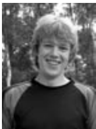
Tobi: Käpt'n mit sagen- haft guten Überblick