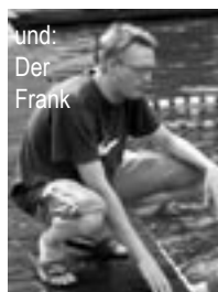
und: Der Frank

Hier könnte Euer Bild sein ! Denn wir such- en immer noch Verstärkung