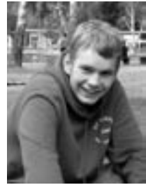
Jan: Gut im Tor; kann auch im Feld was