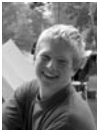
Max: hat den härtes- ten Schuss