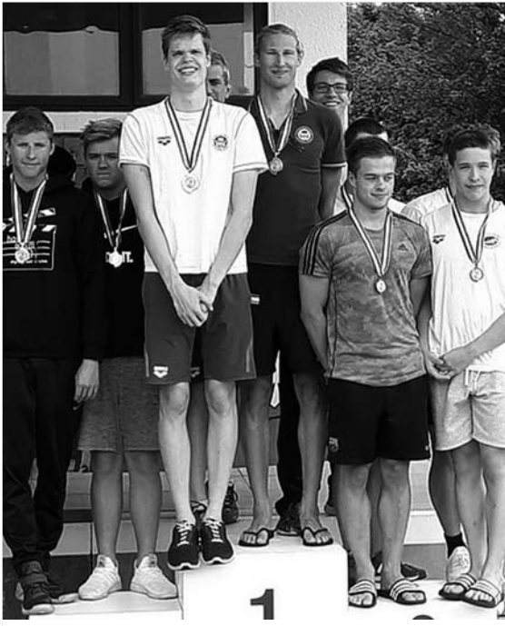
Wiking-Staffel Landesmeister über 4x100m Lagen Männer !